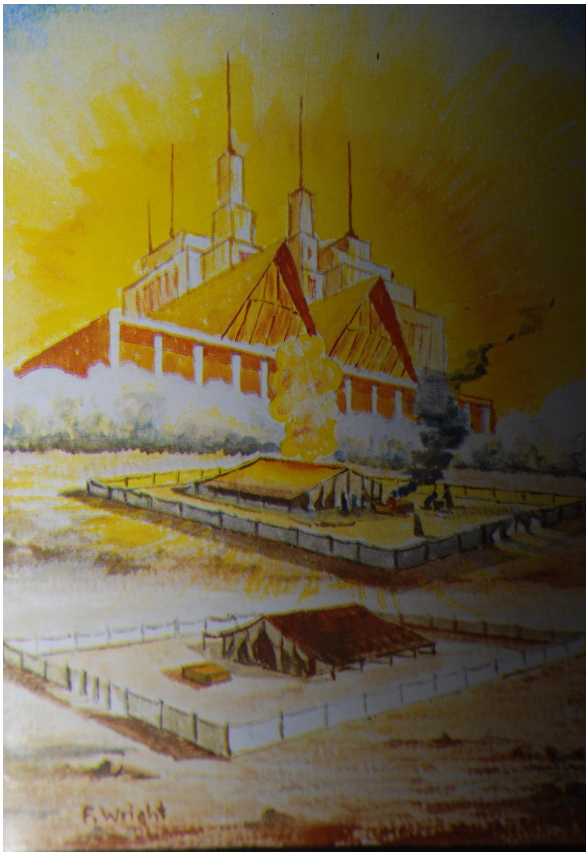
Os Três Templos